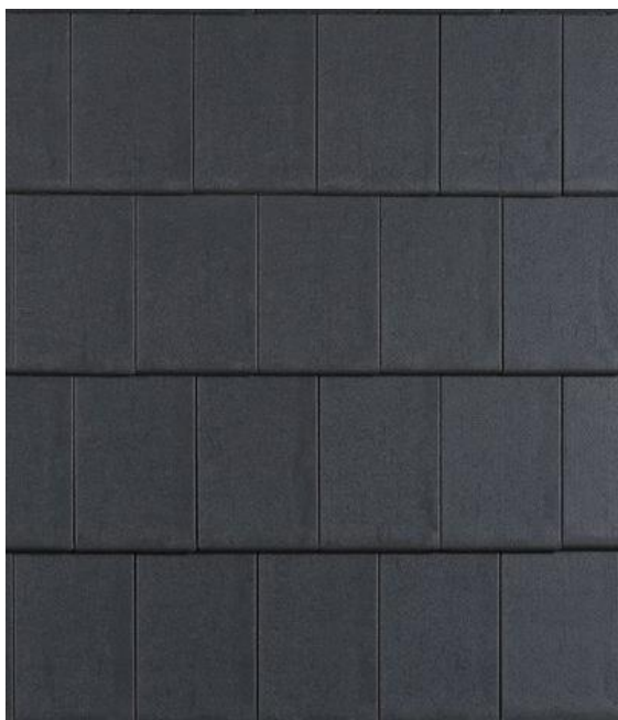
Afbeelding 4: Dakpannen, kruislings gelegd