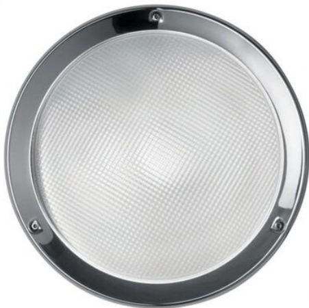
Afbeelding 6: Armatuur woningentree deur stallingsgarage