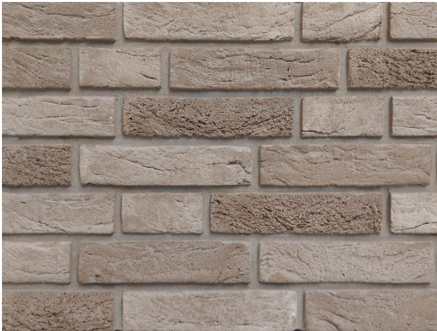
Afbeelding 2: Metselwerk B, stallingsgarage