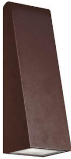
Afbeelding 5: Armatuur woningentree deur daktuin